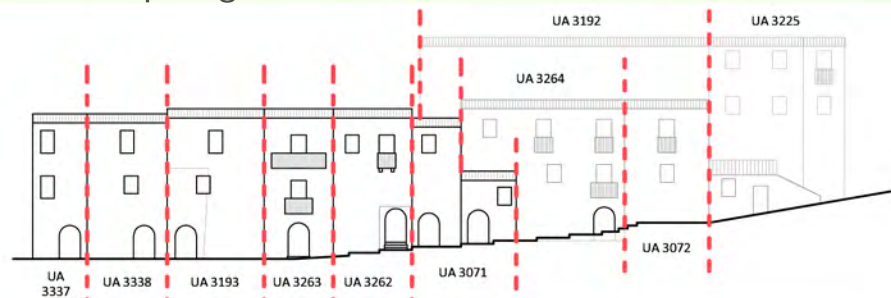
Via San Tussio